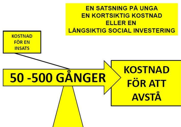
Figur 2. Från rapporten "Utanförskapets pris" av Ingvar Nilsson.

Där går inte att säga en summa för utanförskap då allas situation är olika. En lågt räknad kostnad, baserad på bland andra Ingvar Nilssons rapporter, är 100 000 kr per år och person. Även den summan ökar över tid, se figur 1 ovan.