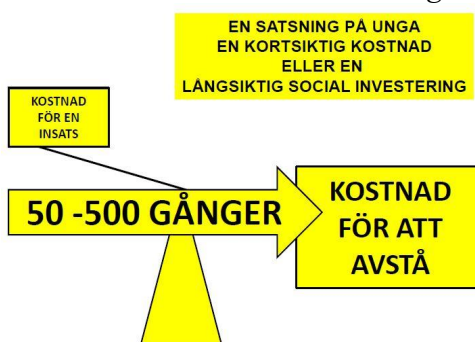
Figur 2. Från rapporten "Utanförskapets pris" av Ingvar Nilsson.