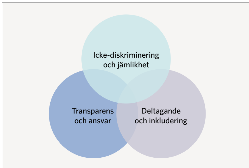
FIGUR 2. De tre principerna

De mänskliga rättigheterna är universella och får aldrig fråntas någon människa.