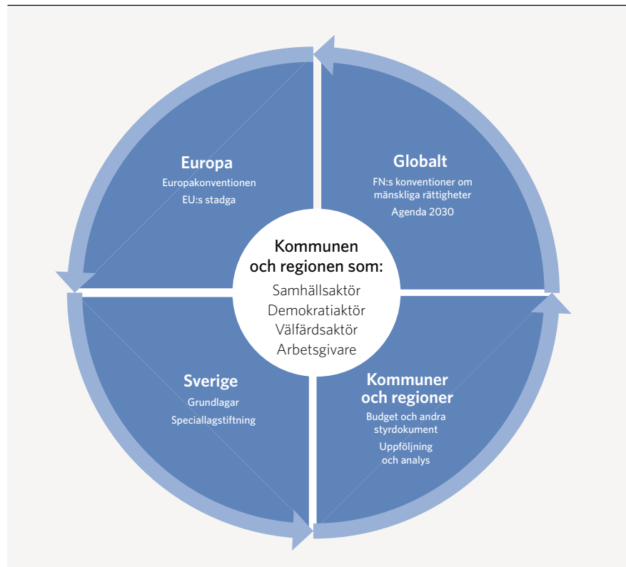
FIGUR 1. Helheten och delarna

Den svenska staten har genom att ratificera regionala och internationella konventioner åtagit sig att respektera, skydda och främja de mänskliga rättigheterna.