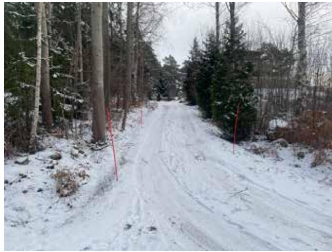
Backen sett från läget för angöringen till fastigheten i söder