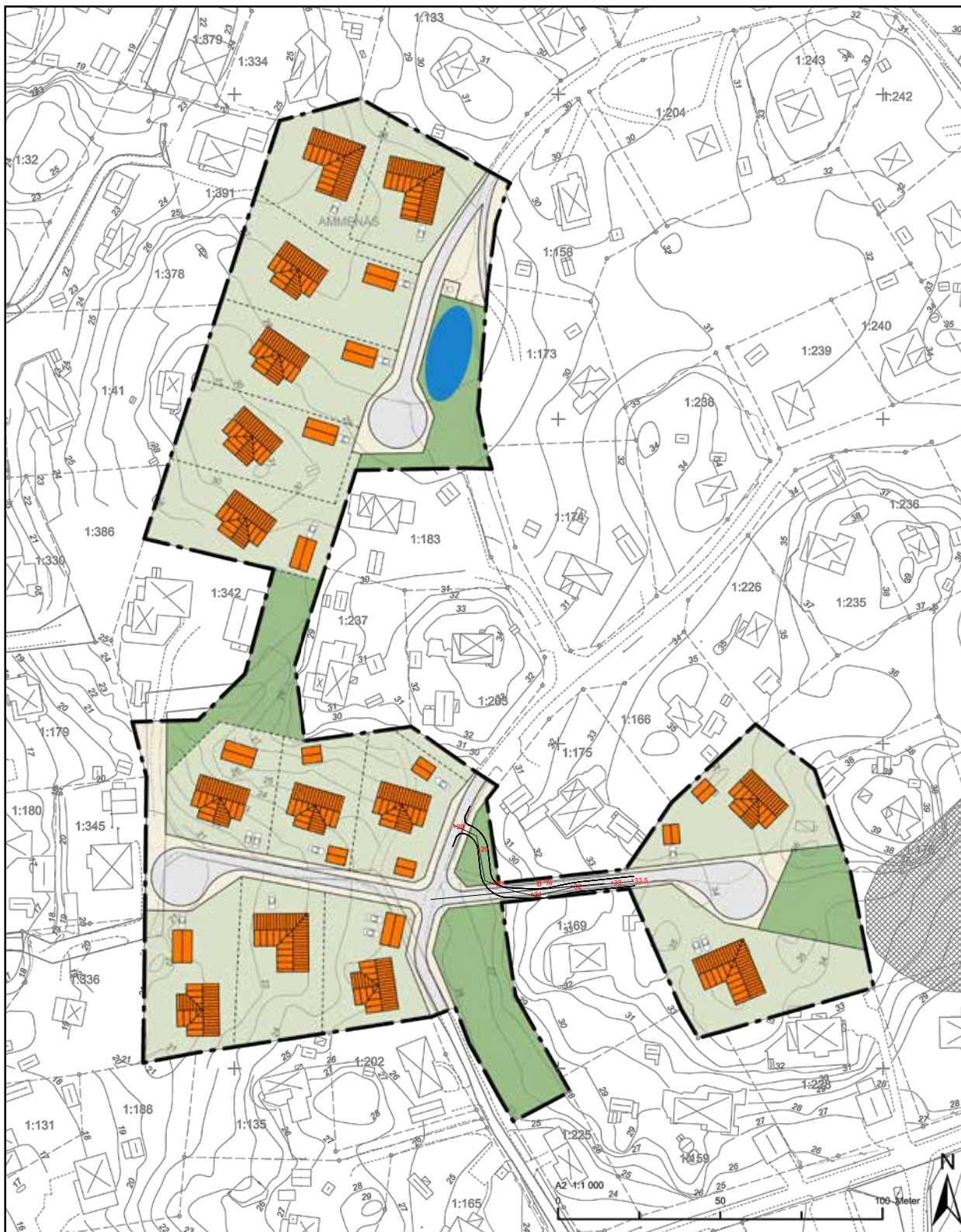
Översikt över hela området med ny vägdragnin g markerad