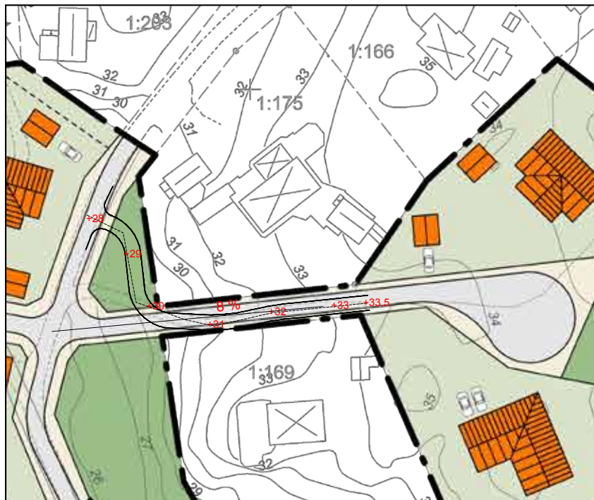
Ny lutning och höjsättning markerad med rött