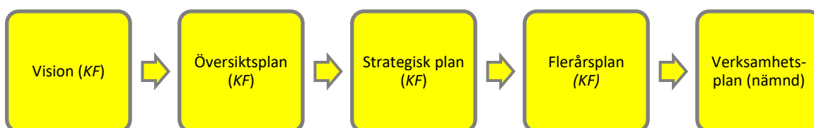
Figur 1. EY:s tolkning av Uddevalla kommuns styr- och ledningsmodell

Styrkortet är kommunfullmäktiges respektive nämndernas processer, där den strategiska politiska nivån sammanfattas. Styrkortet revideras årligen. Kommunfullmäktiges styrkort är nämndövergripande och varje nämnd berörs av valda delar som utgör grunden för varje nämndkort.